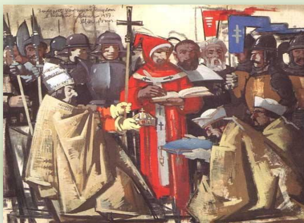
Links Paus Sylvester

Wanneer we meer bekend raken met de oorsprong en de geschiedenis van de Babylonische mysterie-godsdiensten zal ons dat veel meer begrip geven voor en licht werpen op de tegenwoordige toestand in de wereld. Weinigen weten dat de heidense godheden bekendstonden als "Peters" of "Patres" (het Latijnse woord voor "Vaders", in het enkelvoud "Pater"; Red.) en dat zij in de meeste van hun tempels bepaalde priesters hadden die voortdurend " bezig waren met het bedienen van de mysteriën" (Ancient Mythology, vol. 1, p.354).