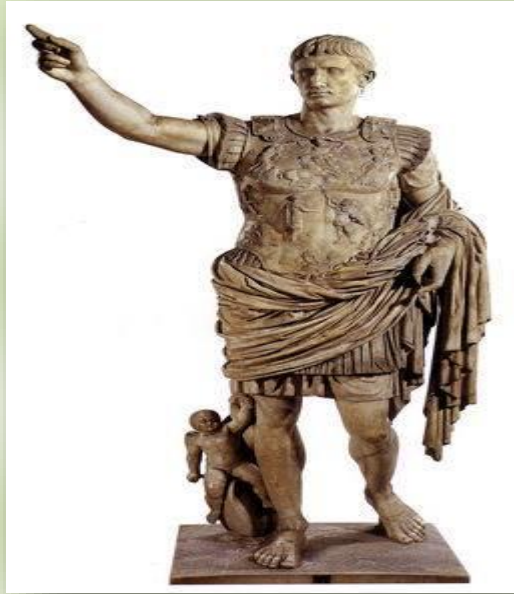
Keizer Konstantijn van Rome.

In het jaar 323 n.Chr. nam keizer Konstantijn officieel dit Simonische Christendom aan, dat niets meer of minder was dan "gedoopt heidendom", en maakte dat tot de staatsgodsdienst van Rome. Op die manier werd de kerk binnengeleid in een periode van degeneratie die vaak wordt genoemd " de donkere Middeleeuwen ".